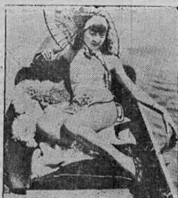
ANNA MAY WONG