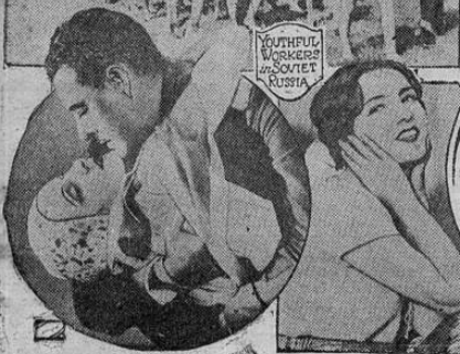
YOUTHFUL WORKERS OF SOVIET RUSSIA